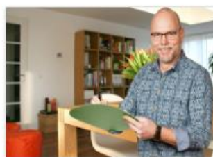
Bezoek aan hufe