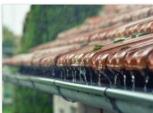
Subsidie verduurzamen woningen: Afkoppelen hemelwater / klimaatadaptatie