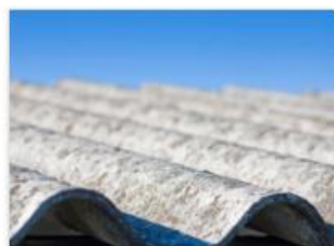
Subsidie verduurzamen woningen: Onderhoud en asbest maatregelen