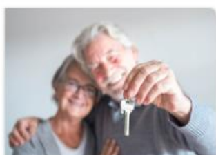
Subsidie verduurzamen woningen: Levensloop bestendige maatregelen