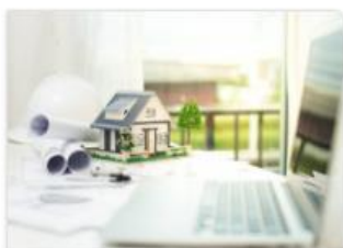
Toekomstbestendig Wonen lening