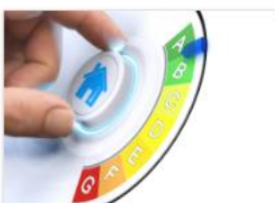
Subsidie verduurzamen woningen: Energiemaatregelen